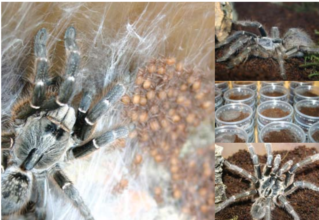
Moeder waakt over haar nakomelingen.

de kleintjes allemaal op een kluitje bovenop het kurkschors, nadat moeders ze voor de nacht had ingesponnen. 's Ochtends nadat de lamp aanging, kropen ze langzaam allen omhoog langs het spinsel richting 'de zon'. Ook daar werden ze gedurende de dag goed door moeders in de gaten gehouden. Om vervolgens bij het ondergaan van 'de zon' weer met zijn allen naar beneden te gaan en zich weer te laten instoppen door mama. Een