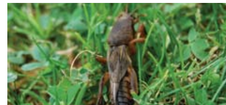
De veenmol in het gras.

Volwassen veenmollen worden in Nederland voornamelijk waargenomen van eind april tot eind mei. Minder vaak zien kenners ze in de maanden juni, juli en augustus en zelden ziet men ze in de overige maanden (winterslaaperperiode). Eind april komen de veenmollen te voorschijn uit hun winterslaap. Van mei t/m juni vind de paring in het holletje plaats. Het vrouwtje bouwt een hol van minimaal 8 cm. tot soms wel 30 cm., met een apart hol voor het nest van ongeveer 10 cm. Hierin legt ze 200 tot 300 witte eitjes, samen zo groot als een kippenei. Vervolgens graaft ze ringgangen en afwateringstunneltjes, boven de grond verwijderd de alle planten, zodat de zon de aarde kan verwarmen.