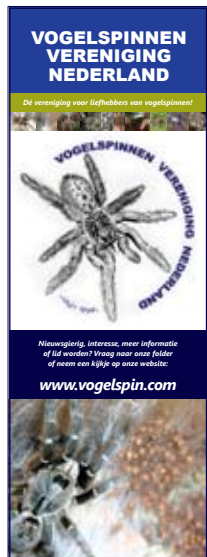
Concept banner beursstand.