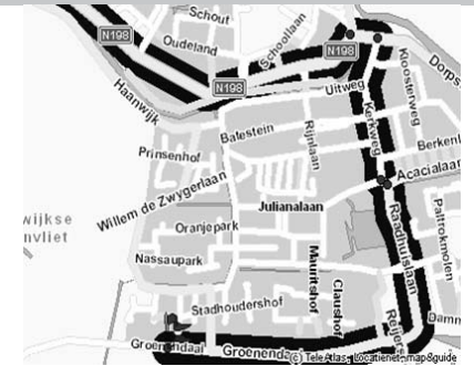
Plattegrond van Harmelen.